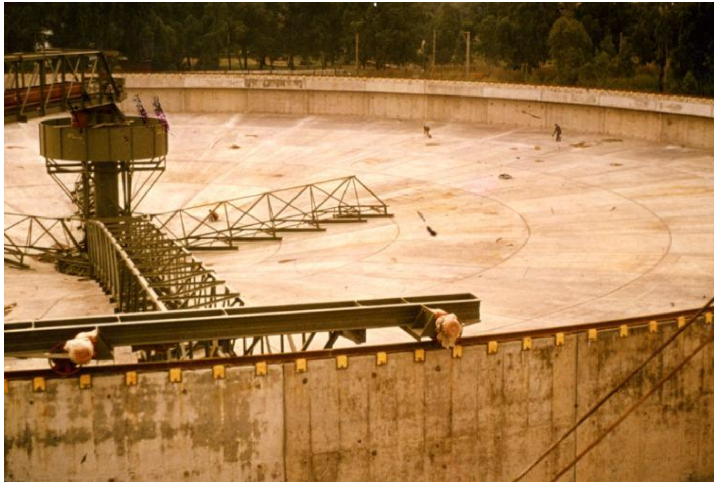
Unutrašnja hidroizolacija tanka za vodu u Južnoj Africi sa KÖSTER NB 1