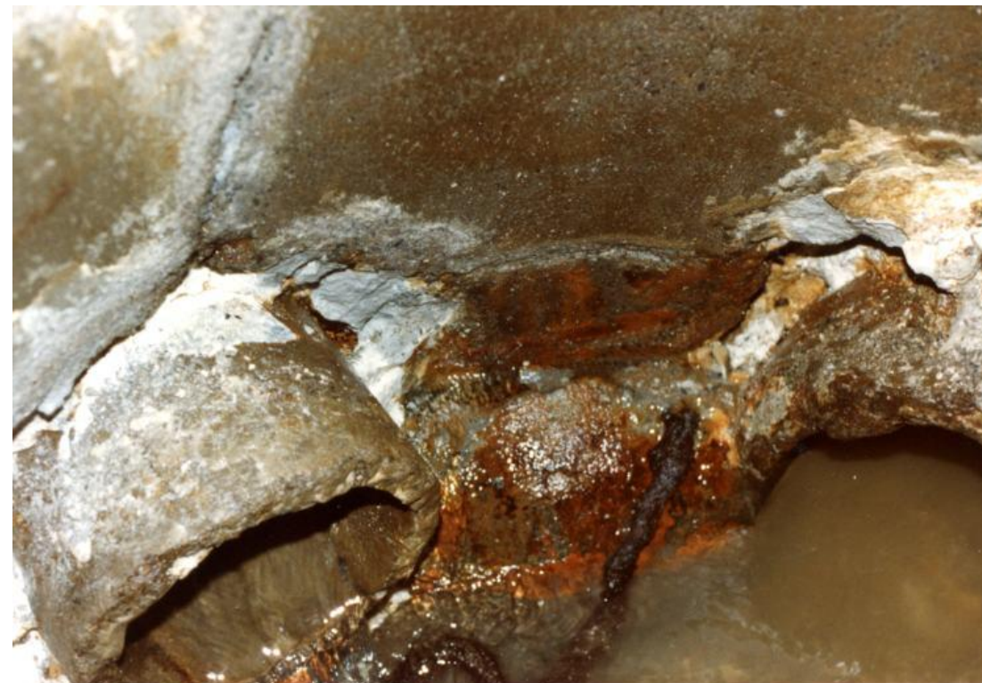
Reparacija i hidroizolacija šahta, Seattle, WA