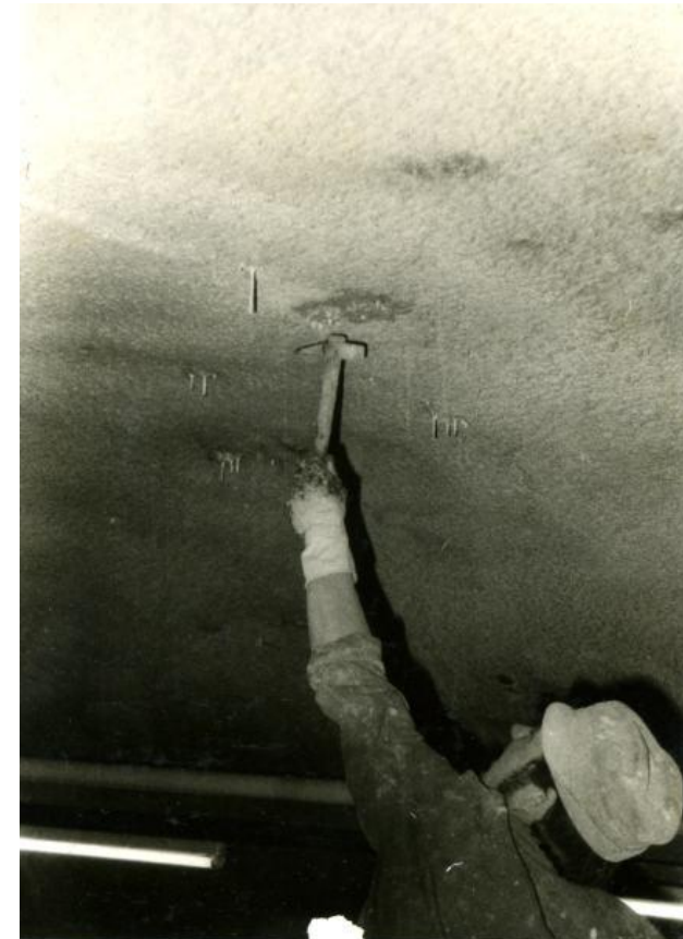
Hidroizolacija starog tunela u Misisipiju, USA