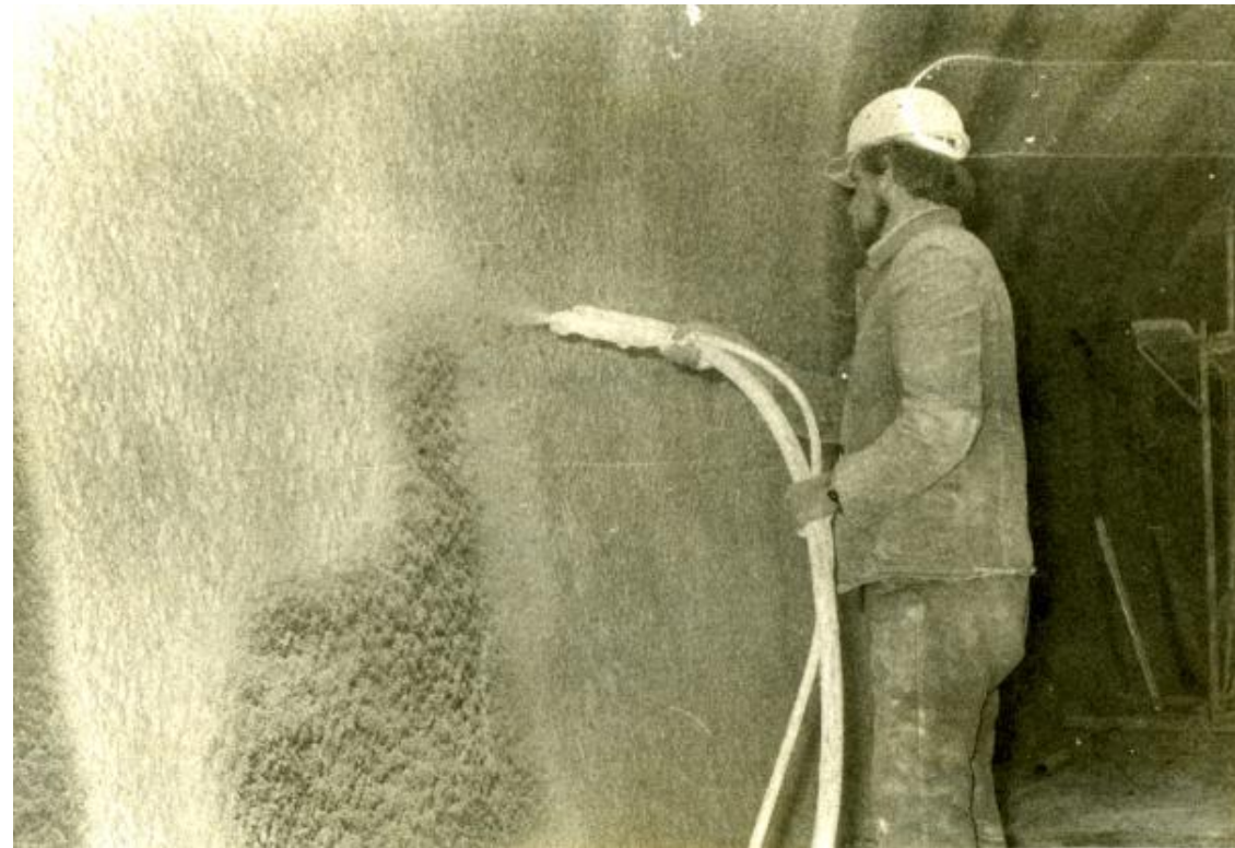
Hidroizolacija starog tunela u Misisipiju, USA