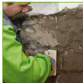
KÖSTER NB 1, prvi sloj