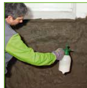
KÖSTER Polysil® TG 500