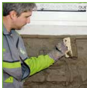
KÖSTER NB 1, drugi sloj