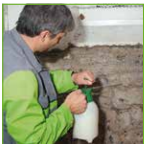
Prajmerisanje sa KÖSTER Polysil TG 500