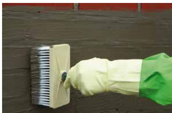
Die KÖSTER Kellerdicht 1 Schlämme wird mit einem Quast oder einer festen Bürste aufgetragen.

Zur Instandsetzung einer schadhafte Kelleraußenabdichtung ist es naheliegend, diese freizulegen und nachzubessern. Diese Art der Nachbesserung scheidet jedoch in vielen Fällen von vornherein aus, weil ein Aufgraben entweder zu teuer oder zu aufwändig ist. Sei es, dass bei Teilunterkellerungen ein Zugang zu den überbauten Außenwänden unmöglich ist oder dass Überbauten wie Garagen, Auffahrten oder Straßen bestehen. Eine einfach durchzuführende und kostengünstige Alternative ist die Abdichtung von innen (Negativabdichtung).