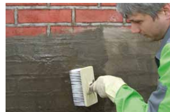
KÖSTER Kellerdicht 3 Härte-Flüssig wird ohne Wartezeit und mit einem sauberen Quast aufgestrichen.