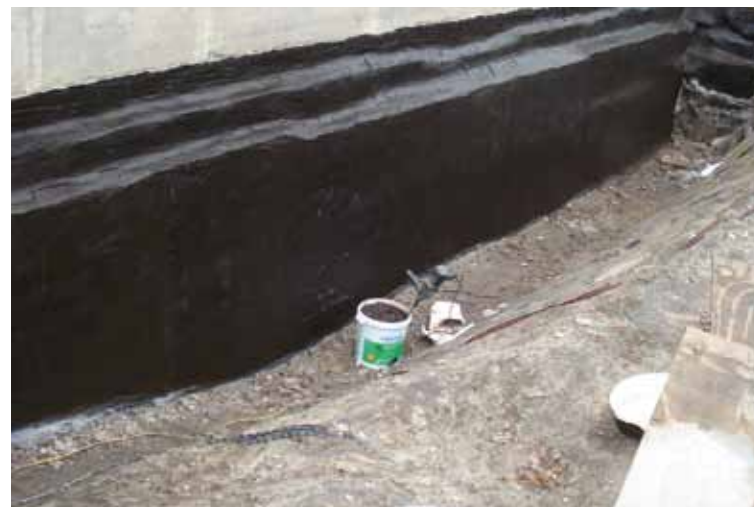
Das abgedichtete Mauerwerk