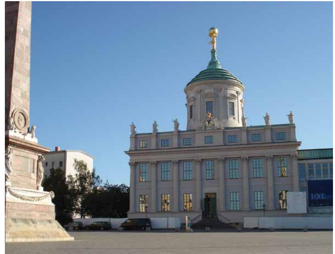
Erstrahlt in neuem Glanz: das historische Potsdamer Rathaus