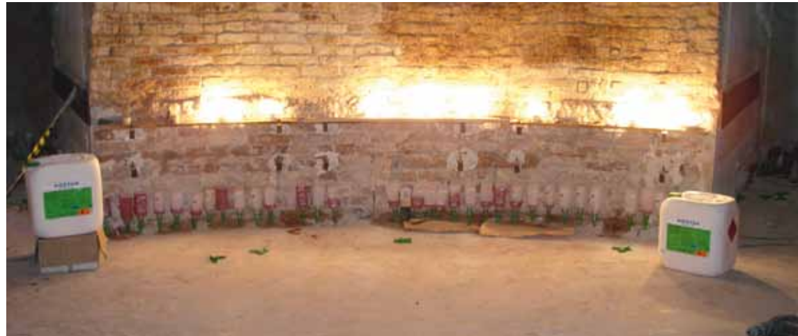
Installation der Horizontalsperre

Material in Rissen oder Hohlräumen, wie sie in historischem Mauerwerk oft vorkommen, verloren (siehe Grafik). Darüber hinaus gibt dieses patentierte, drucklose Verfahren dem Material aber auch Zeit, sich bis in die feinsten Kapillaren zu verteilen und somit eine möglichst gleichmäßige Abdichtung herzustellen. Aufgrund der Mauerstärke wurde beim Alten Rathaus von zwei Seiten gleichzeitig gearbeitet.