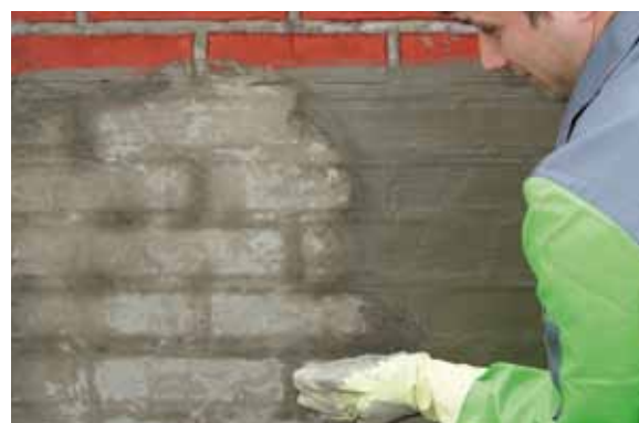
Das KÖSTER Kellerdicht 2 Blitzpulver wird per Hand in die frische, nasse Schlämme eingerieben, bis die Fläche trocken ist.