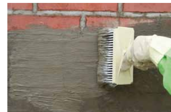
Direkt im Anschluss wird ein weiteres Mal die KÖSTER Kellerdicht 1 Schlämme aufgetragen. Dieser Schritt wird nach 30 Min. noch einmal wiederholt.

Zur Abdichtung feuchter Keller hat die KÖSTER BAUCHEMIE AG das KÖSTER Kellerdicht-Verfahren entwickelt, welches sich schon seit Jahrzehnten bewährt. Damit werden undichte Flächen und Einzelstellen, selbst wenn das Wasser fließt, schnell und einfach abgedichtet. Der Erfolg ist sofort sichtbar.