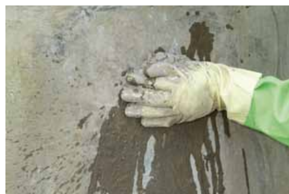
... in Sekunden...