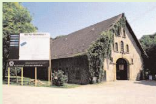
Das Objekt: Im Sattelmeierhof wurden bis Mitte der Fünfziger Jahre Pferde, Rinder und Schweine gehalten.