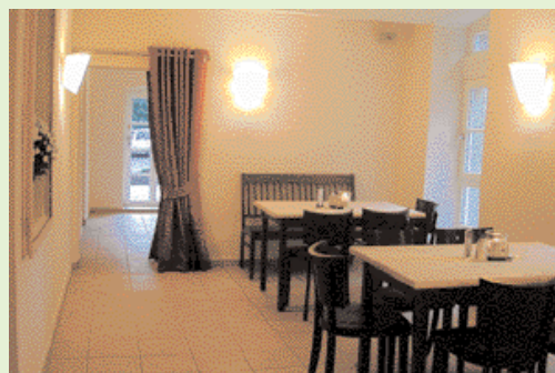
Garantiert dicht: Die neue Nutzung des Sattelmeierhofes nach der gesamten Renovierung.