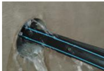
Wassereintritt an einer ...

Ein besonderer Vorteil der Paste auf Polyolefin-Basis ist auch, dass sie nicht austrocknet, sondern dauerhaft formbar bleibt. Diese Plastizität garantiert eine beständige Abdichtung und eröffnet die Möglichkeit, auch später noch Leitungen durch die bestehende Abdichtungsmasse hindurch zu führen, ohne dass Stemmarbeiten oder Neuabdichtungen erforderlich sind.