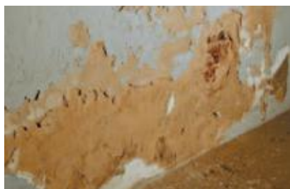
Innen deutlich sichtbar: Feuchte und Schimmelbildung an nahezu allen Wänden.

aussen, an den 60 cm dicken Bruchsteinmauern, waren ungleichmäßige Salzausblühungen bis zu einer Höhe von 1,5 m sichtbar. Besonders dort, wo Rinder- und Schweineställe von innen sowie Dunghaufen von außen ehemals für