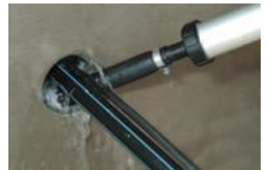
... Kabeldurchführung wird mit ...