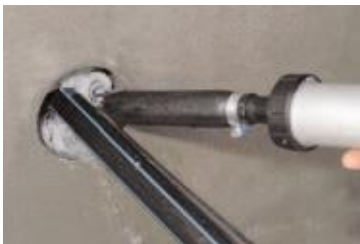
... KÖSTER KB-Flex 200 Dichtpaste ...