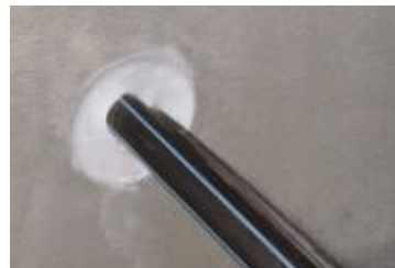
... und dauerhaft sicher gestoppt.