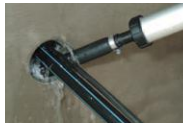
... Kabeldurchführung wird mit ...