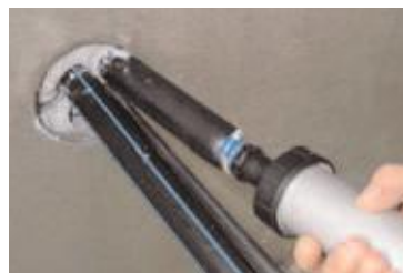
... sofort, unkompliziert ...