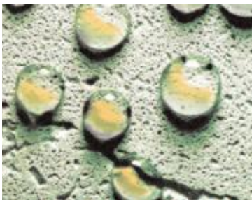
Nach der Hydrophobierung: Wasser bildet Tropfen und perlt ab.

Die Forschungs- und Entwicklungsabteilung der KÖSTER BAUCHEMIE AG hat sich die Aufgabe gestellt, eine effizientere Fassadencreme mit optimierter Wirkung zu entwickeln. Denn die handelsüblichen Fassadencremes enthalten Lösungsmittel, die sich schnell verflüchtigen – und ein Teil des Wirkstoffes ebenso. Darüber hinaus führt es dazu, dass die behandelte Oberfläche danach oft „speckig“ erscheint.